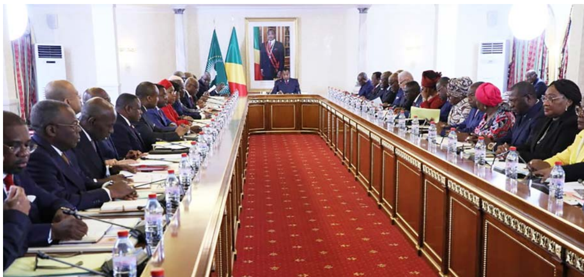
Le gouvernement en conseil des ministres, le 6 mai à Brazzaville.

Le peuple attend également une meilleure desserte en électricité, grâce notamment à la réhabilitation en cours de la ligne très haute tension Pointe-Noire-Brazzaville. Le président de la République a évoqué, par ailleurs, la remise effective des installations électriques prêtes dans la ville de Mossaka et la réalisation rapide de la desserte en électricité des localités comme Louingui, Boko et Loumo. Les objectifs de production d'eau potable sont aussi une urgence pour laquelle le gouvernement