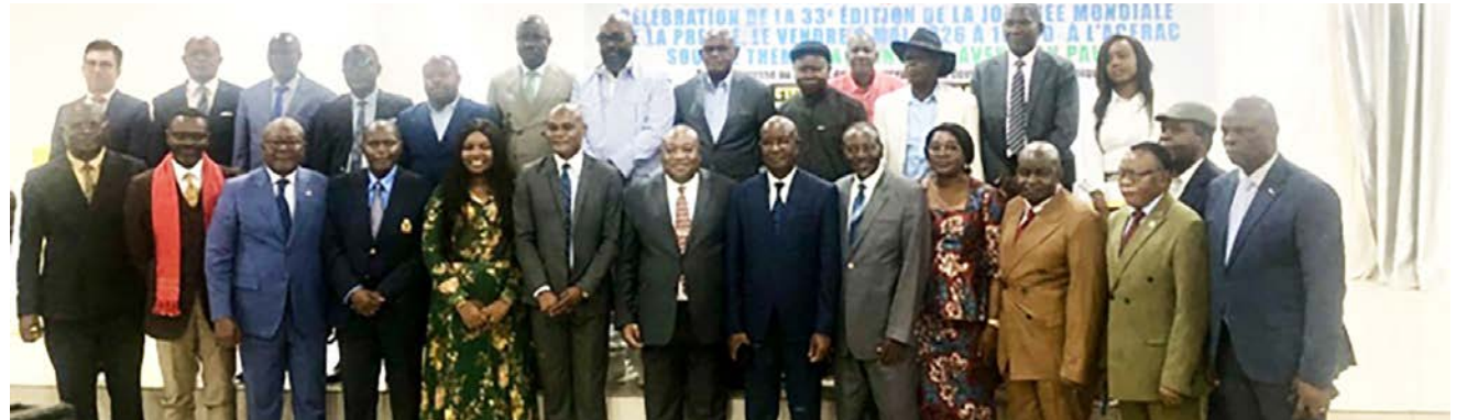
Des représentants des institutions et des organes des médias

L'Union des professionnels de la presse du Congo (UPPC) a célébré en différé, le 8 mai à Brazzaville, en partenariat avec Journalisme et éthique (JEC), la 33 e édition de la Journée internationale de la liberté de la presse sur le thème « Façonner un avenir en paix ». Tout en commémorant cette journée dédiée à la promotion des libertés fondamentales du métier de journaliste, les chevaliers du micro et de la plume en ont profité pour attirer l'attention des pouvoirs publics sur la précarité persistante des médias congolais.