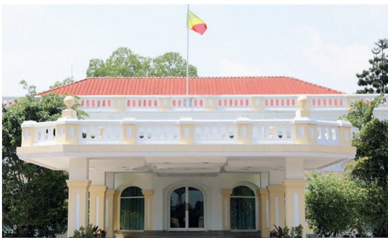
Palais du peuple

Sont-ils tous prêts ? Après une première séquence dans notre édition datée du 11 mai, voici la suite (et non pas la fin) du dossier de la rédaction des Dépêches de Brazzaville sur les hommes et les femmes qui sont appelés à concrétiser aux côtés