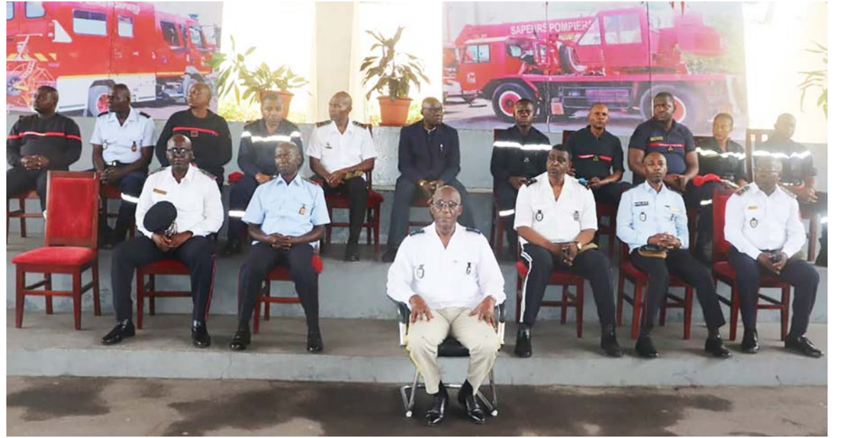
Au premier plan, le général Albert Ngoto, à l'arrière plan, le commandement de la sécurité civile

S'agissant de la comparaison par année, il est constaté une hausse globale de 6,5%, passant de 26 859 à 28 725 interventions. Le secours à victimes reste largement dominant (93,7%) et constitue le principal moteur de cette progression (+6,6%). Les opérations diverses (+10,4%) et l'assistance à personne (+5%) sont également en hausse, tandis que les accidents de circulation (-9,3%) et les risques technologiques reculent. Les incendies demeurent globalement stables. Cette évolu-