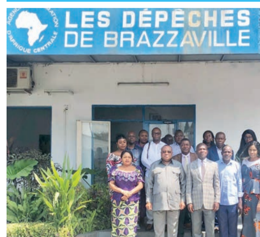
Le président du CSLC et des responsables des Dépêches de Brazzaville