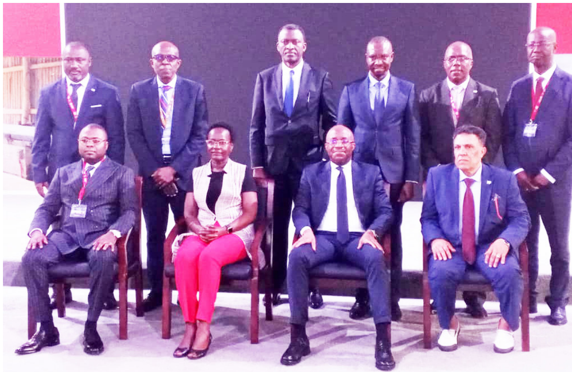
Les membres du Conseil d'administration de l'AIAFD posant en groupe à l'issue de la réunion. Adiac point de l'exercice écoulé et d'élaborer notre plan stratégique pour les années à venir. Nous recueillons en même temps les doléances des IFD afin de booster le développe-

« Nous sommes une association des institutions de financement de développement en Afrique, dotée de plus de 100 IFD qui œuvrent pour le développement économique. Nous tenons notre assemblée annuelle avec toutes les associations affiliées, pour faire le