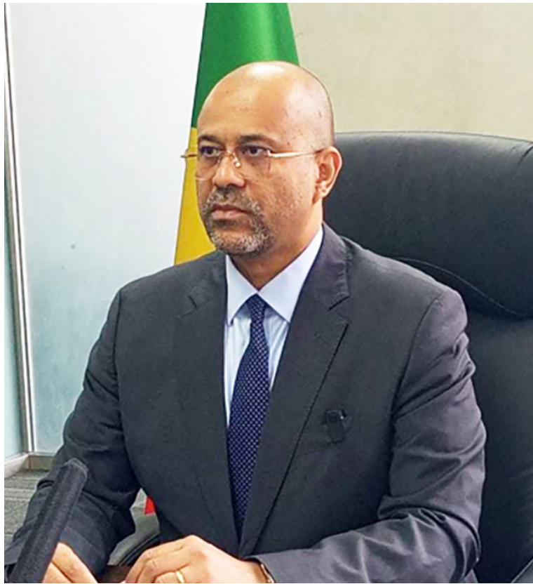
Michel Djombo, ministre en charge du Développement industriel

« Dans les secteurs de l'énergie, du commerce, des hydrocarbures ou encore des services, des instruments de mesure fiables garantissent l'équité, sécurisent les recettes publiques et renforcent la confiance dans les institutions. Elle accompagne les politiques liées à la transition énergétique, à la santé publique, à la sécurité alimentaire et à la protection