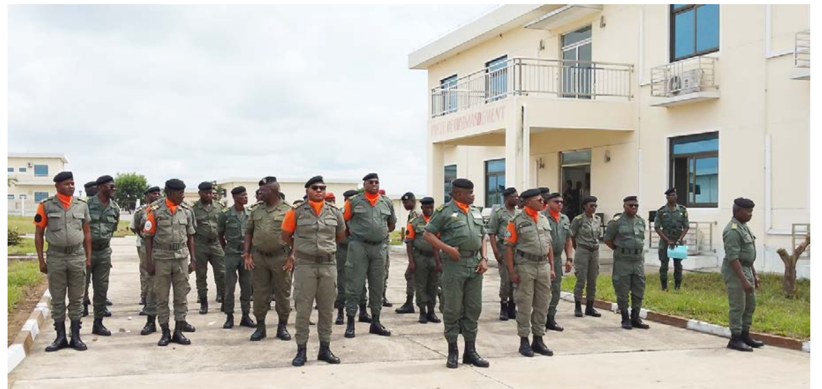
Le commandant de la logistique entouré de ses collaborateurs

Le stage préparatoire visant l'obtention du Certificat d'aptitude technique n°2 (CAT-2) logistique, pour les filières Autos et engins blindés (AEB), et Armement, munitions et optiques (AMO), session 2026 Case Barnier, s'est ouvert le 20 mai à Brazzaville, sous l'égide du commandant de la logistique des Forces armées congolaises (FAC), le général de brigade Fortuné Niakékélé.