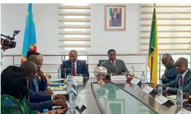
Les deux ministres en charge de la Justice et leurs délégations lors de la séance de travail

Le ministre chargé de la Justice, Aimé Ange Wilfrid Bininga, a évoqué dans la capitale congolaise avec son homologue de la République démocratique du Congo, Guillaume Ngefa, les questions concernant l'actualisation de l'accord de coopération judiciaire conclu entre les deux pays en 1978 qui présenterait certaines « faiblesses ».