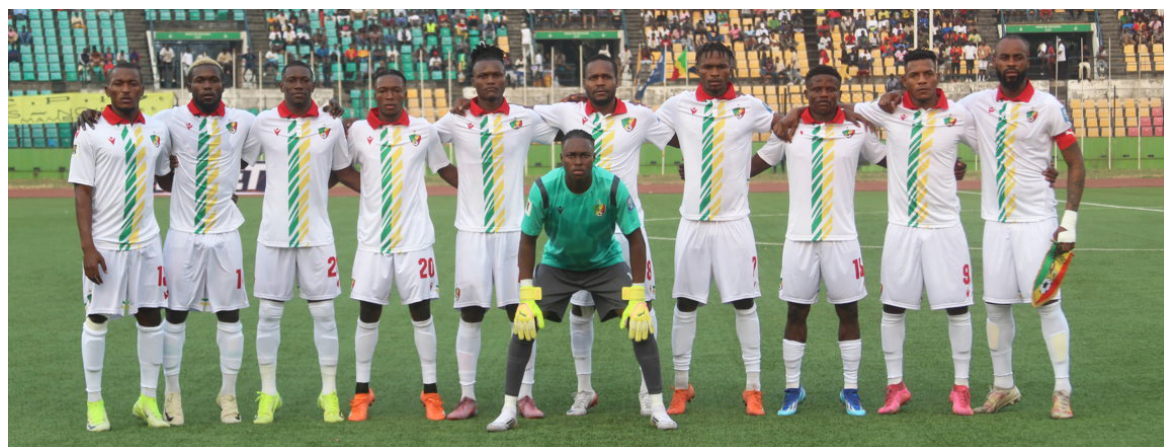
Les Diabes rouges à prendre au sérieux, selon les adversaires

Et d'ajouter : « Le Congo n'est pas une équipe à prendre à la légère non plus. C'est maintenant à nous de nous concentrer sur nous-mêmes. Nous aborderons chaque match avec l'objectif de le gagner, car chaque équipe est une force avec la-