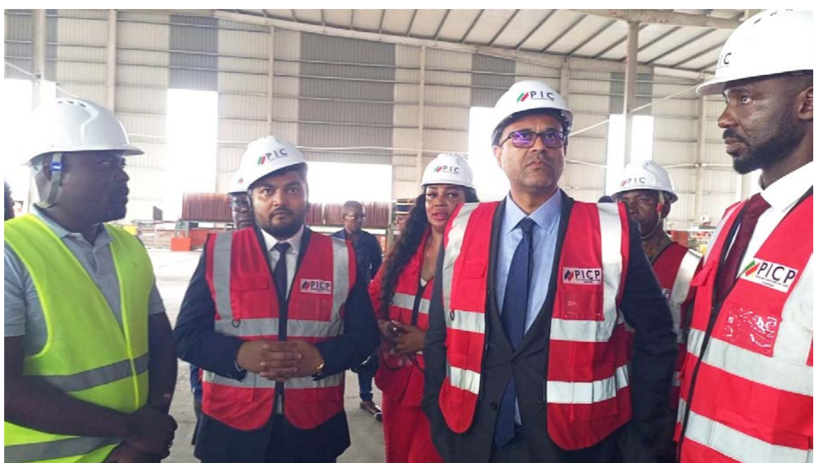
Le ministre Michel Djombo visitant une structure de la ZES de Pointe-Noire

Pour le ministre, il est impossible de développer une zone industrielle sans infrastructures routières adaptées, devant faciliter le transport des intrants et l'exportation des produits finis en toute sécurité.