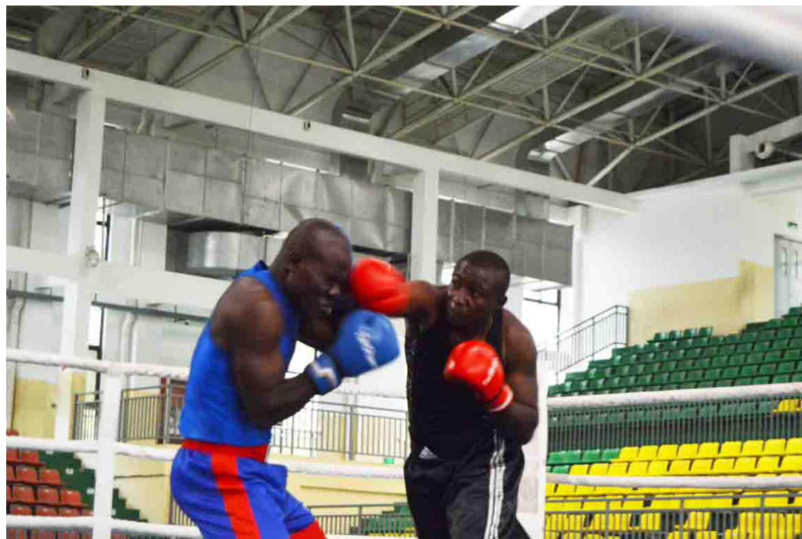
Un combat de boxe

La Fédération congolaise de boxe (Fécoboxe) a posé les jalons de la relance en publiant la liste des boxeurs présélectionnés pour un regroupement du 27 mai au 20 juin comptant pour la préparation des Championnats d'Afrique de la zone 3.