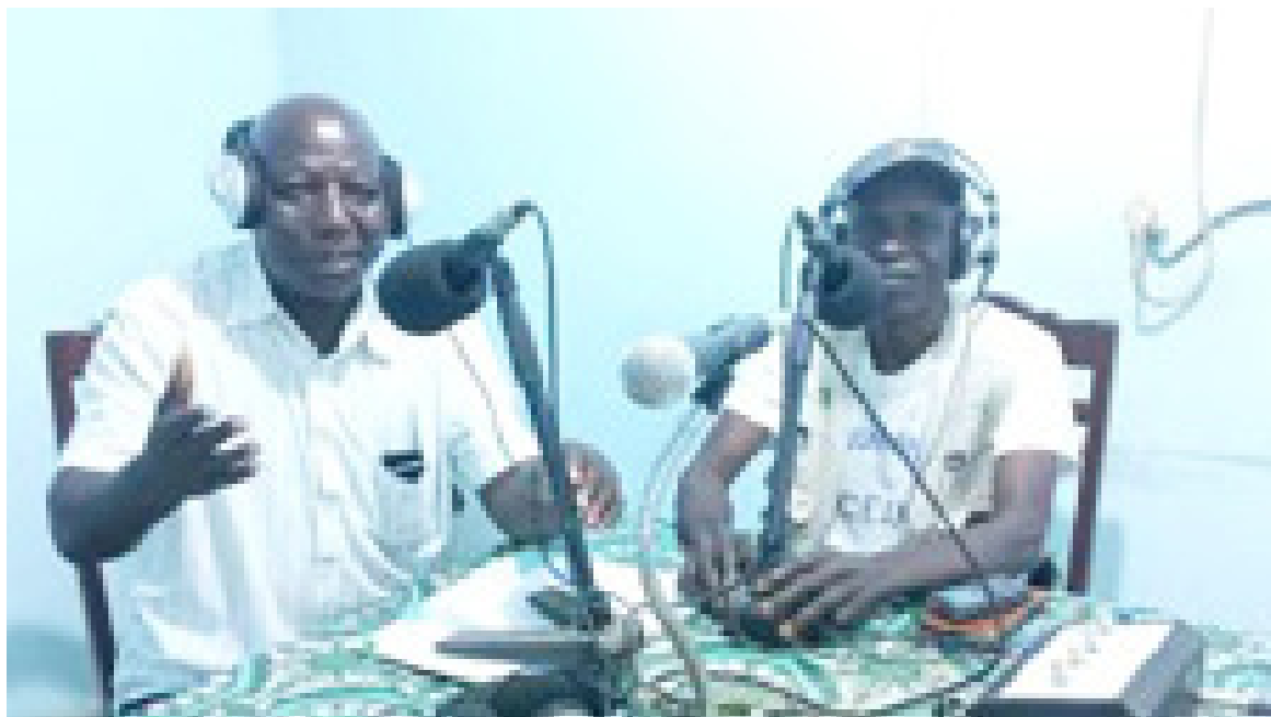
Vue partielle du studio de la radio communautaire de Mindouli/Adiac

À partir de ses studios à Mindouli, elle diffuse ses programmes en français, en lari et lingala, couvrant par ses ondes un rayon estimé à 60 km aux alentours. Cette estimation a été élaborée à la suite de l'interprétation d'un récent rapport d'écoute. Il ressort que la carte de l'auditoire de la RCM s'étend dans toute l'étendue du district de Mindouli, des départements de la Bouenza, de la Lékoumou, des localités de Kimba ; Vindza et Mayama, dans le département du Djoué Léfini. Lors de la réception de la presse,