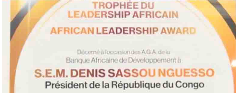
Le chef de l’État, Denis Sassou N’Guesso, réceptionnant ses prix des mains du Premier ministre, Anatole Collinet Makosso.

nistres des Finances. L’attribution de ce trophée à un chef d’État constitue ainsi une reconnaissance exceptionnelle.