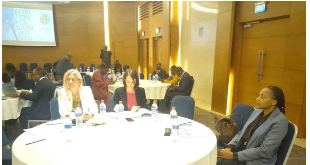
Des échanges entre experts, bailleurs et partenaires internationaux

Le projet Biodev 2030 est une initiative qui promeut un dialogue multipartite basé sur la science pour intégrer la biodiversité dans les stratégies de