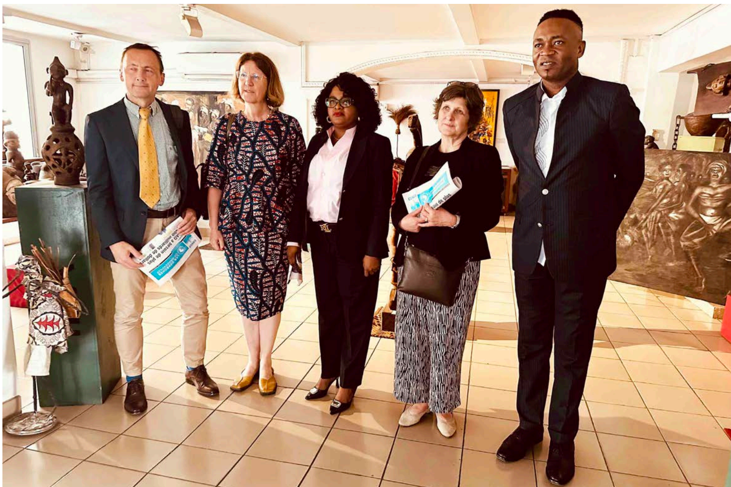
Les diplomates belges visitant le groupe Adiac en présence de sa directrice générale