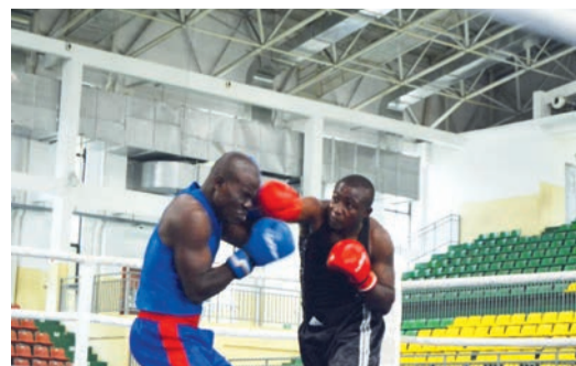
Un combat de boxe

La liste des athlètes nationaux présélectionnés pour participer à un regroupement préparatoire aux championnats d'Afrique de la zone 3 a été rendue publique par la Fédération congolaise de boxe. Prévu du 27 mai au 20 juin, ce stage se déroule aussi bien à Brazzaville qu'à Pointe-Noire.