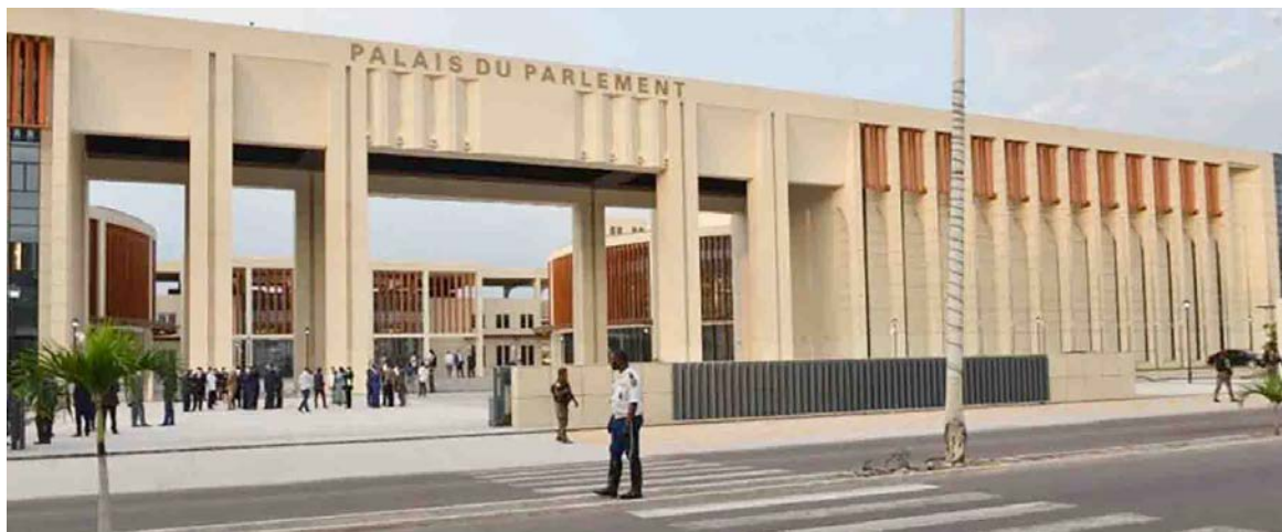
Le siège du Parlement