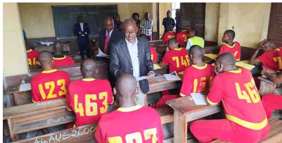
Lancement de l'épreuve d'anglais au centre de la maison d'arrêt

Le chef de centre s'est lui aussi félici-