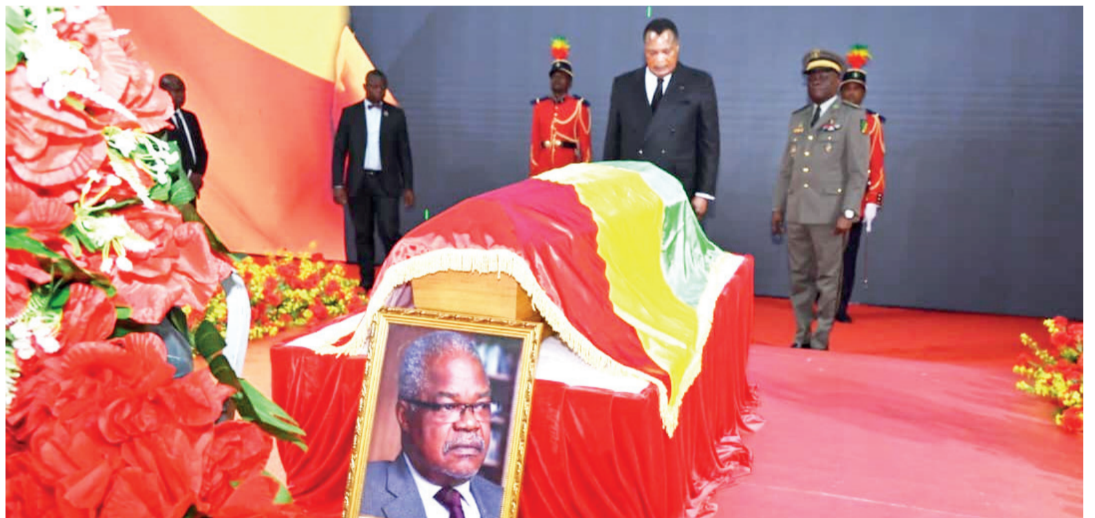
Le président Denis Sassou N'Gusso s'inclinant devant la dépouille du disparu