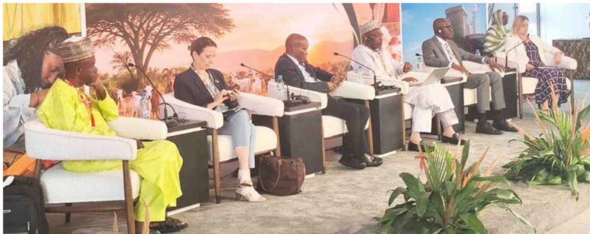
Les officiels et les partenaires plaidant pour un financement conséquent