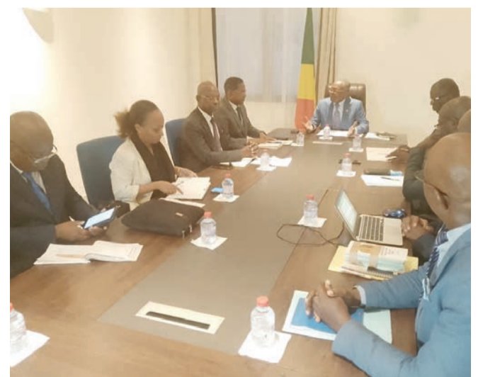
Les deux parties en discussions

Une délégation des experts onusiens conduite par le coordonnateur du système des Nations unies au Congo, Abdourahamane Diallo, a échangé avec le ministre de la Réforme de l'État et des Relations avec le Parlement, Luc Joseph Okio, sur la préparation d'un nouveau Cadre de coopération pour le développement durable 2027-2031 et l'intégration des enjeux de gouvernance et de réforme de l'État dans les priorités de développement du Congo.