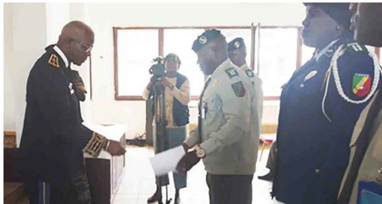
Remise du diplôme à l'un des promus par le DGAF