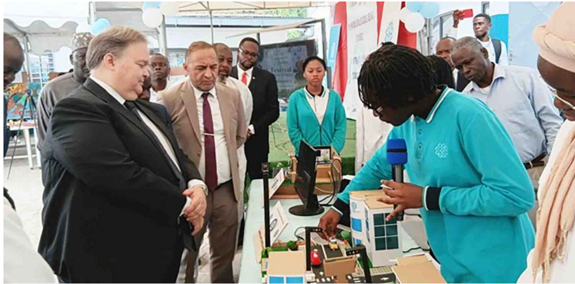
L'ambassadeur Hilmi Ege Türemen admirant la créativité des élèves

tisme est un générateur électromagnétique. Il est composé, entre autres, d'un interrupteur qui nous permet de lancer et d'interrompre le courant à volonté. Lorsque nous démarrons le moteur, cela crée un champ