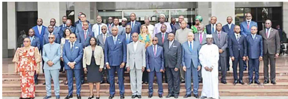
La photo de famille à l'issue de la communication du ministre aux chefs de missions diplomatiques et consulaires accrédités au Congo, membres du Groupe Afrique/DR

Il a ajouté que cette vision inspire depuis toujours l'action du président de la République, De-