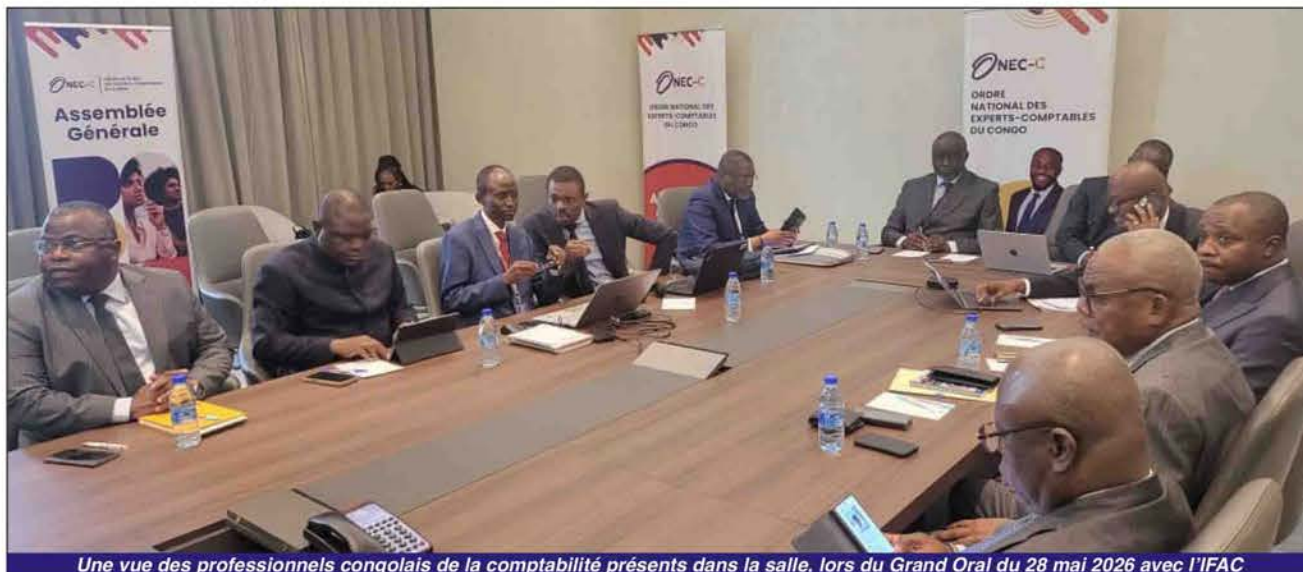
Une vue des professionnels congolais de la comptabilité présents dans la salle, lors du Grand Oral du 28 mai 2026 avec l'IFAC

Après quatre ans d'un processus rigoureux d'évaluation, l'Ordre national des experts-comptables du Congo (ONEC-C) a passé, jeudi 28 mai 2026, son entretien final avec la Fédération internationale des comptables (IFAC). Une étape décisive qui place le Congo aux portes d'une reconnaissance comptable mondiale.