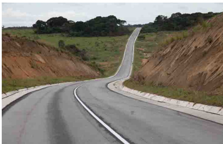
L'axe Oyo-Obouya-Boundji-Lékéty, au Congo DR

La dynamique d'intégration économique en Afrique centrale se poursuit avec le lancement du processus préparatoire de Pro Meet Up 2026, une plateforme de concertation et de mobilisation des investissements. Une session inaugurale s'est ouverte le 1er juin dernier dans la capitale camerounaise, réunissant plusieurs acteurs institutionnels et économiques de la sous-région. Cette initiative, portée par Pro Meet Up, vise à créer un espace de dialogue entre les secteurs public et privé ainsi que les partenaires au développement. Elle ambitionne de favoriser la mise en relation des acteurs, la co-construction de projets structurants et l'émergence de partenariats durables pour soutenir le développement économique de