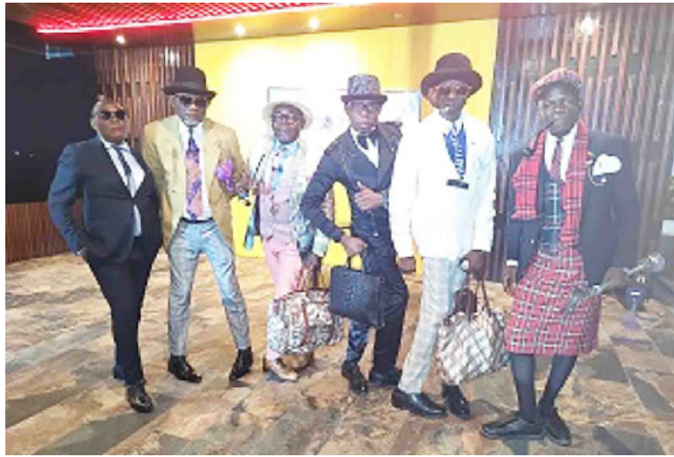
Les sapeurs membres de la DSEC à la soirée.