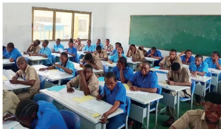
Les candidats au BEPC passeront les épreuves du 23 au 26 juin.