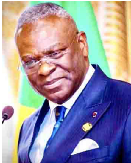
Le Premier ministre Anatole Collinet Makosso

L'académicien souligne l'augmentation des échanges commerciaux entre la Chine et l'Afrique ;