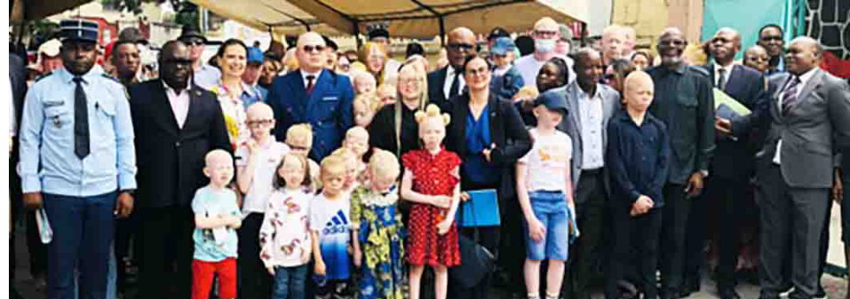
Des officiels et les albinos présents à la cérémonie

La Journée internationale de sensibilisation à l'albinisme a été célébrée le 13 juin, à Brazzaville, par l'Association Jhony-Chancel pour les albinos (AJCA), en présence des autorités administratives, des partenaires internationaux et de la société civile. Placée sur le thème « Bien dans ma peau, célébrons toutes les nuances de couleur de peau », l'édition 2026 a mis l'accent sur la vulgarisation de la loi n°18-2025 du 25 juillet 2025 relative à la protection et à la promotion des droits des personnes vivant avec handicap.