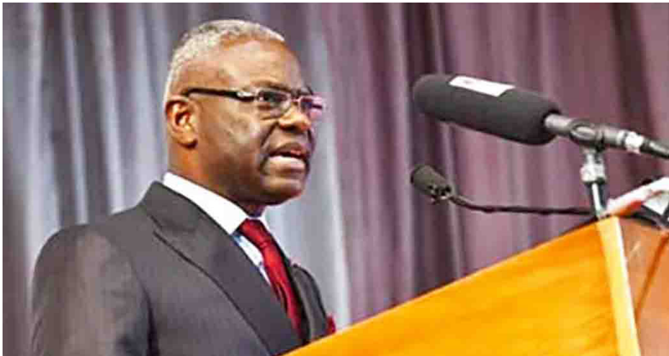
Le Premier ministre devant l'Assemblée nationale

« À son entrée en fonction, le Premier ministre présente devant l'Assemblée le Programme d'action du gouvernement. La présentation ne donne lieu ni à un débat, ni à un vote », dispose l'article 103 de la Constitution du 25 octobre 2015.