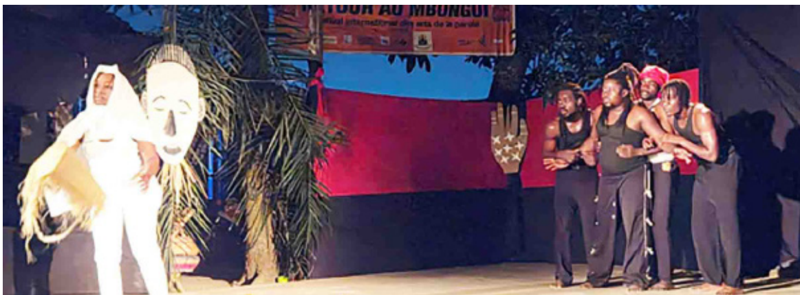
Le spectacle «Contes et légendes du royaume de Loango » joué à l'Espace culturel Yaro/Adiac

A l'occasion de la 26 e édition du festival international de contes « Retour au mbongui », le spectacle « Contes et légendes du royaume de Loango » a été joué, le 11 juin, au Centre des ressources de contes à Côte matève, et le 13 juin à l'Espace culturel Yaro à Loandjili, Pointe-Noire.