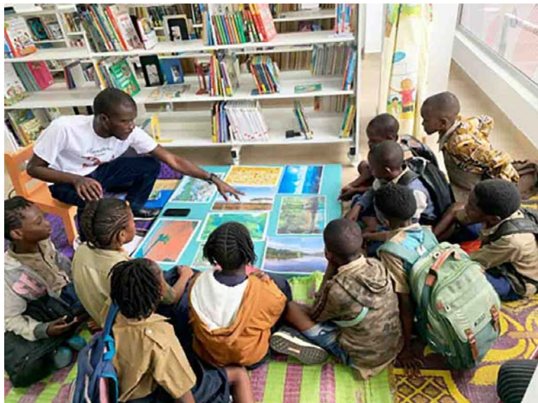
Un atelier des enfants

Cette année, ce rendez-vous s'intégrait dans le projet national d'éducation et de sensibilisation à l'environnement porté par l'association à travers le Partenariat pour les écosystèmes forestiers, la nature et le climat (Country package) qui