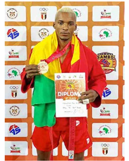
Déo Grâce Makoutika Ndoudi en bronze