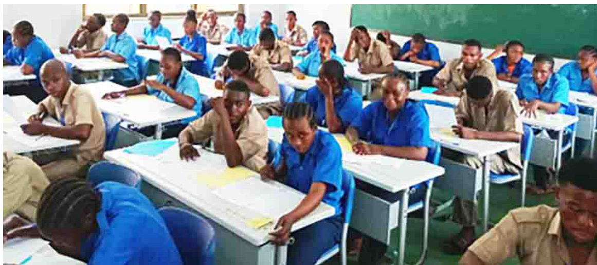
Les candidats au BEPC passeront les épreuves du 23 au 26 juin

Le mardi 23 juin, les candidats passeront les épreuves de mathématiques, d'histoire et de géographie. L'anglais, les sciences de la vie et de la terre auront lieu le mercredi 24 juin. Les sciences physiques et dictée-questions le jeudi 25, tandis que le vendredi 26, l'examen prendra fin par l'expression écrite et l'éducation physique et sportive. « Nous sommes dans un principe de zéro fraude aux examens d'État. Les téléphones, les montres intelligentes, les calculatrices programmables,