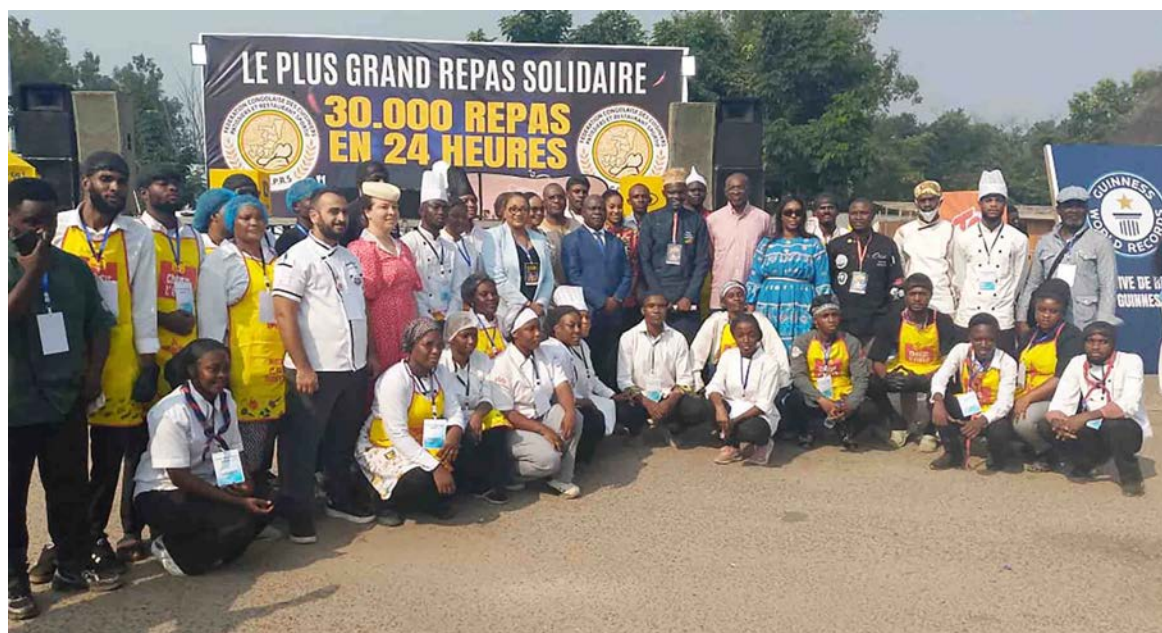
Préparation avant la distribution des repas chauds