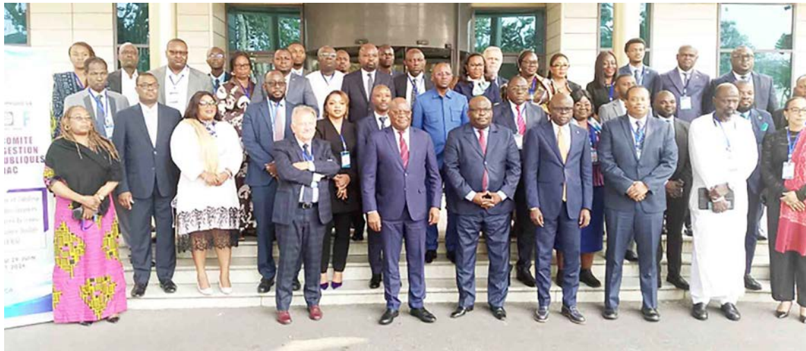
Les parties prenantes impliquées dans le diagnostic Adiac