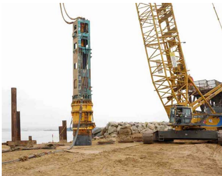
Des pieux installés au Môle Est

« Derrière chaque pieu battu se cache un travail d'ingénierie minutieux. Le savoir-faire de notre part-