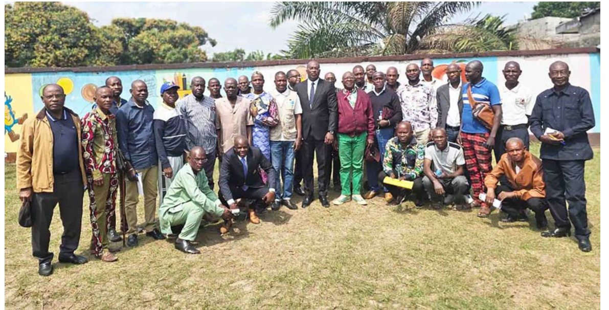
Les participants après la réunion organisée par la Fondation Pro social inter États/Adiac

Au cours de la réunion, le représentant-résident a également présenté les étapes préparatoires du projet, à savoir la mobilisation des acteurs communautaires, le recensement des ateliers et centres de formation existants dans chacun des quartiers, l'évaluation de leurs capacités d'accueil, la