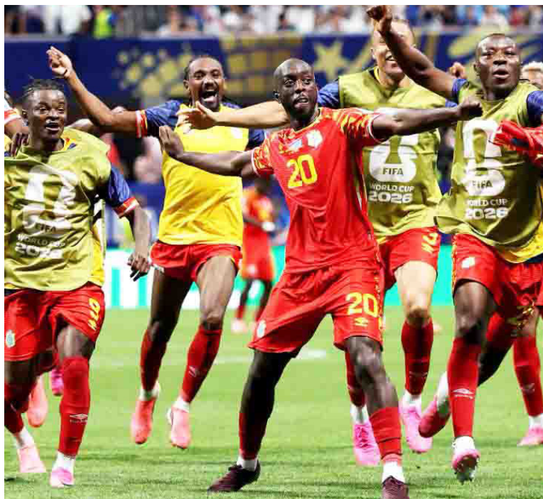
Les Congolais exultent après leur qualification historique pour la prochaine phase de la Coupe du monde /Fifa

Dans le groupe E, les Ivoiriens sont au coude-à-coude avec les Allemands (6 points chacun). Si les Eléphants se sont inclinés face aux quadruples champions du monde (2-1, après avoir ouvert le score), ils ont ensuite fait le boulot contre l'Équateur et Curaçao. Parmi les atouts de la Côte d'Ivoire, sa cohésion défensive, qui ne sera pas de