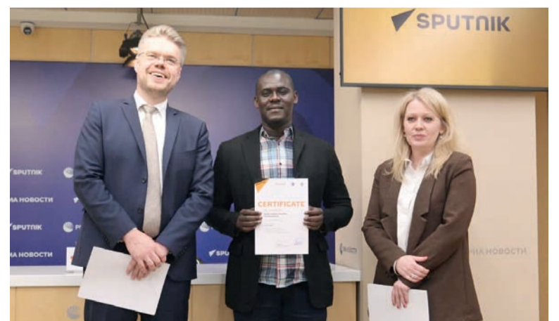
Remise de certificat au représentant congolais