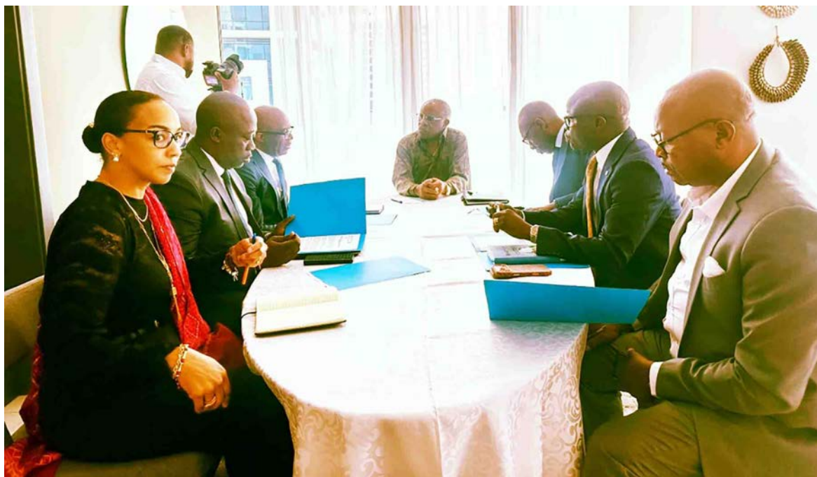
Les autorités communautaires s'activent face à Ebola/DR

Cette mobilisation s'inscrit dans le cadre de la Décision n°02/26-UEAC-114-CM-45 adoptée le 13 juin dernier par le Conseil des ministres de l'Union économique de l'Afrique centrale, instituant une feuille de route pour la prévention et la préparation de la riposte à la maladie à virus Ebola. Ce texte prévoit notamment la création d'un Fonds spécial d'urgence sanitaire, dont une partie importante est financée par le Fonds de développement de la communauté (Fodec), administré par la