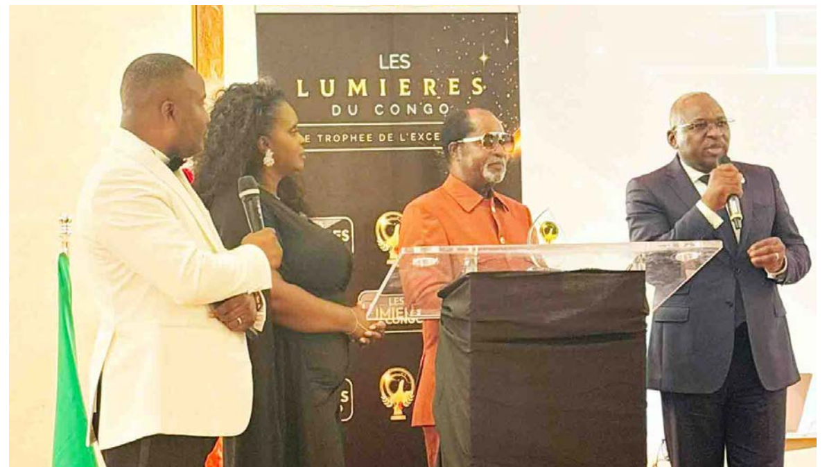
Les lumières du Congo 2026

Le Prix du rayonnement de l'action publique a été attribué au commissaire colonel-major Mi-