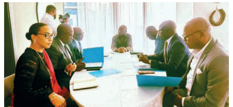
Les autorités communautaires s'activent face à Ebola. DR

La Banque de développement des États de l'Afrique centrale et la Communauté économique et monétaire de l'Afrique centrale ont convenu d'accélérer le décaissement du Fonds spécial d'urgence sanitaire, afin de faire face au risque de propagation du virus Ebola dans la sous-région.