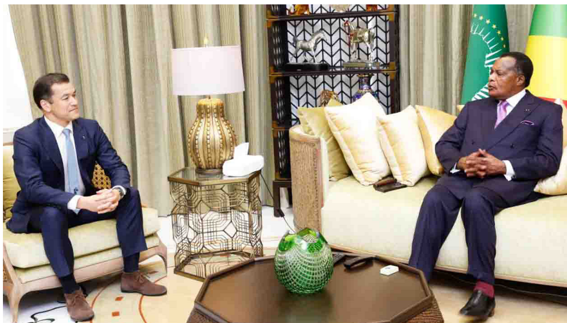
Le chef de l'Etat s'entretenant avec le PDG de Perenco

« Nous prévoyons d'investir plus de deux milliards de dollars sur les cinq prochaines années, essentiellement sur le forage, avec un vaste programme de ré-