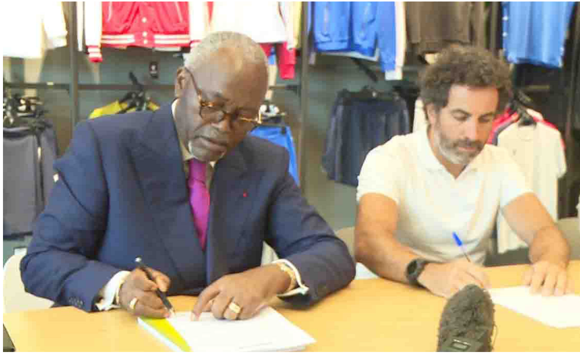
Le ministre en charge des Sports paraphant le contrat avec l'équipementier Macron.

Désormais, précisent les clauses du contrat, l'ensemble des fédérations sportives nationales sera doté de maillots Macron de haute qualité pour la participation des Diabes rouges aux compétitions internationales. L'uniformisation des équipements pour l'ensemble des