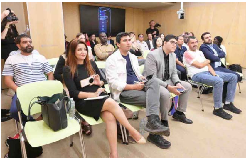
Vu des participants

Alliant ateliers pratiques et analyses stratégiques, le programme a permis aux participants d'explorer l'intégration concrète de l'IA dans la routine journalistique, de la veille automatisée