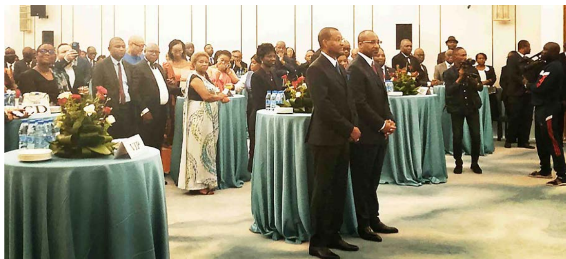
L'ambassadeur rwandais entouré de ses invités.