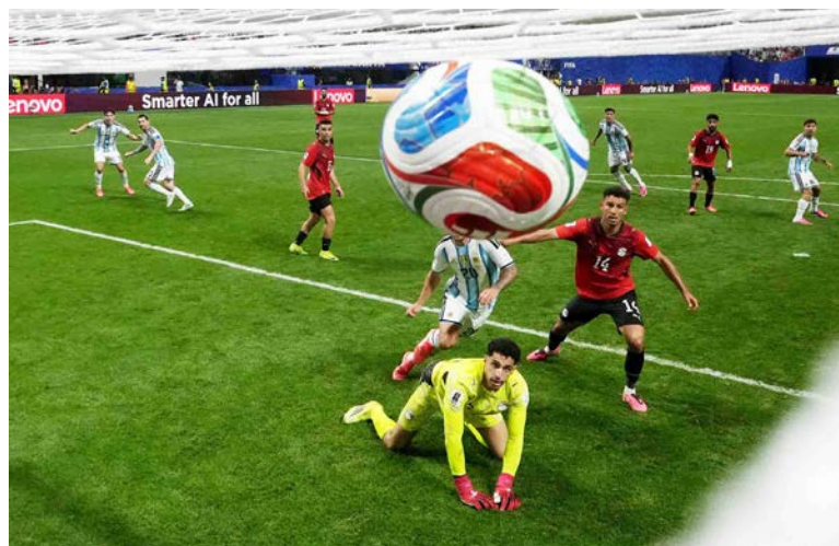
L'Égypte de Shobeir, qui a longtemps fait la course en tête, s'incline finalement face à l'Argentine de Messi

Très bien organisée, l'Égypte fait douter l'Argentine et double même le score à la conclusion d'un contre d'école, mené par Haissem Hassan, relayé par Salah et conclu par Zico (58 e ). Un but finalement refusé pour une faute sur Lopez en début d'action.