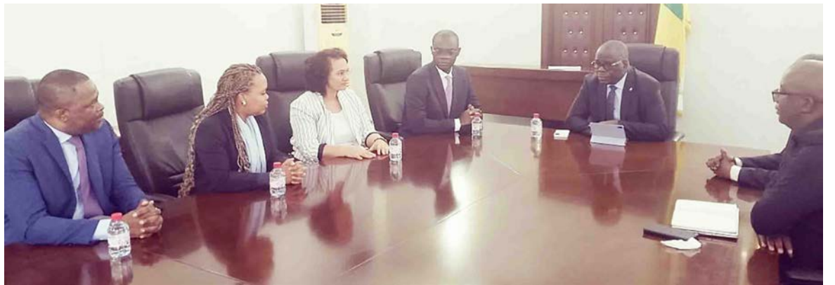
Lors de la rencontre avec le directeur de cabinet

À l'issue de cette phase de renforcement des capacités, l'INS engagera les travaux préparatoires de la future enquête sur l'emploi et le secteur informel, dont le lancement sur le terrain est prévu en janvier 2027. Cette enquête sera réalisée chaque trimestre et permettra de produire régulièrement des indicateurs essentiels du marché du travail, notamment le taux d'emploi, le taux de chômage, le