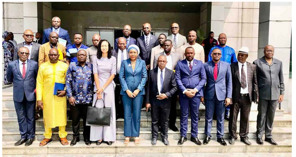
La ministre et des membres des organisations patronales

Insistant sur le rôle clé des organisations patronales, elle a invité ses hôtes à parcourir le récent décret du 28 juin 2026 fixant les attributions de son département. Elle a souligné qu'il ne s'agissait pas de s'enfermer dans un seul domaine, mais d'embrasser l'ensemble de ses missions. « Comment pourrai-je élaborer des stratégies en vue de l'extension de la couverture sociale sans vous, sans vos contributions, sans votre expérience, sans l'expression de vos besoins ? », a-t-elle demandé aux organisations, avant d'ajouter: « Je veux que chacun de vous s'imprègne de mes attributions ». La ministre a particulièrement insisté sur le volet « prévoyance sociale », où le décret prévoit l'organisation