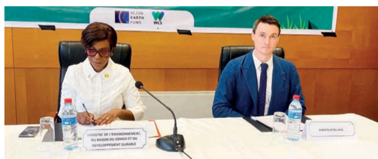
La ministre de l'Environnement ouvrant l'atelier en compagnie d'un partenaire/Adiac financement de la biodiversité et du Développement durable, a indiqué la ministre de l'Environnement, du Bassin du Congo

Quatre nouvelles zones clés pour la biodiversité ont été découvertes. Deux dans la tourbière de la Likouala, une marécageuse dans la Sangha et une autre à l'île Mbamou, dans le département de Brazzaville. « Les nouvelles zones clés offrent une base scientifique solide pour orienter les décisions relatives à la conservation, à l'aménagement du territoire, à la gestion durable des ressources naturelles et au développement des mécanismes innovants de