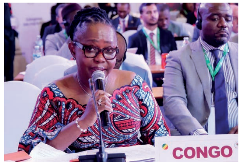
La ministre Jacqueline Lydia Mikolo aux assises d'Abuja

Le pays assure désormais la deuxième vice-présidence du bureau du Conseil des ministres du Commerce de la Zone de libre-échange continentale africaine (Zlécaf).