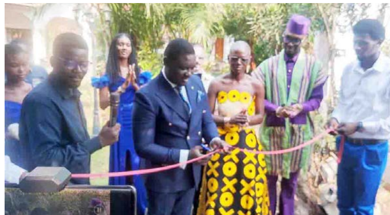
La coupure du ruban par le représentant de la DDAL/Adiac

Peu après la cérémonie d'ouverture, un échange entre les médias, les mannequins, les créateurs et les partenaires a